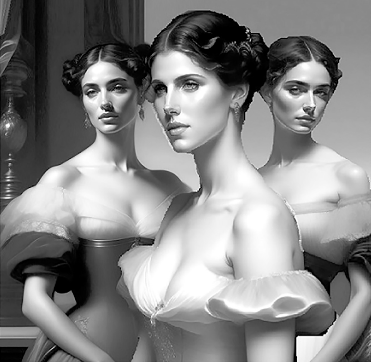
Сестры Ревелл — героини романа «Быть подлецом»

— Люди рационального мышления действительно были немало удивлены, когда оказалось, что рациональное объяснение мира не удовлетворило мир, и оказалось, что миру нужны не только научные объяснения, но и сказки, чудеса, и даже причуды нечисти. Феномен «Гарри Поттера» тому подтверждение. К тому же рационализм, как ни старался, не мог объяснить трансцендентные стороны бытия, а страшный опыт XX века, века Дахау и Бухенвальда, показал, насколько