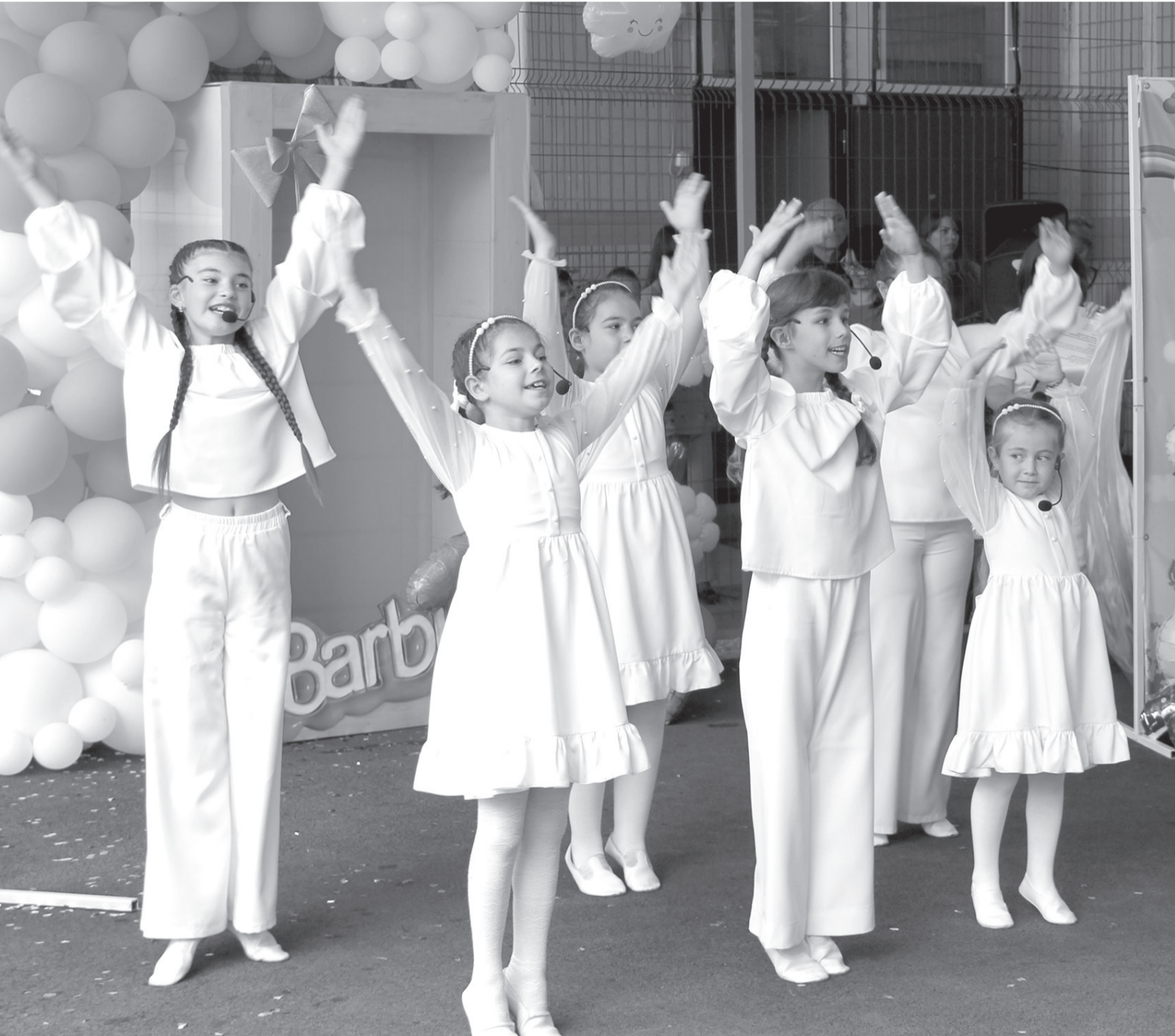
Яркие номера на празднике показали учащиеся детской школы искусств Усть-Джегутинского района

Добро В этом заведении особенные дети получают не только ежедневную заботу, но и поддержку, возможность учиться в комфортных условиях, развиваться, ощущать себя нужными и важными. Воспитатели круглосуточно помогают детям и следят за порядком, который давно стал законом для всех обитателей дома-интерната. А еще в этом доме